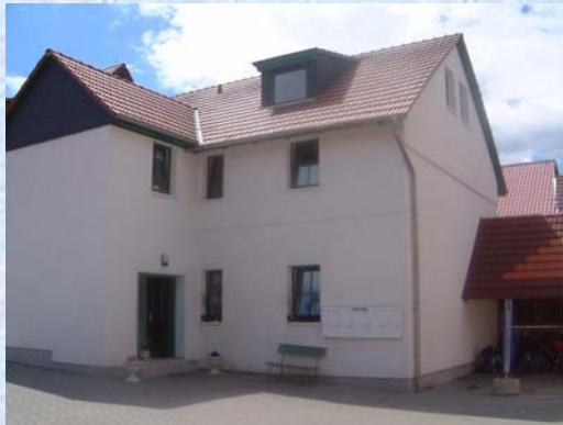
Brunnengasse 3 – Bild 3