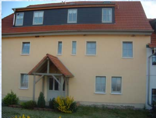
Brunnengasse 5 – Bild 3