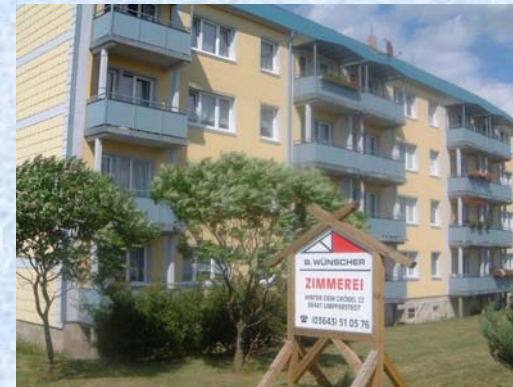
Bad Sulzaer Str. 95– Bild 2