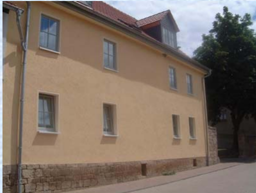
Brunnengasse 5 – Bild 1