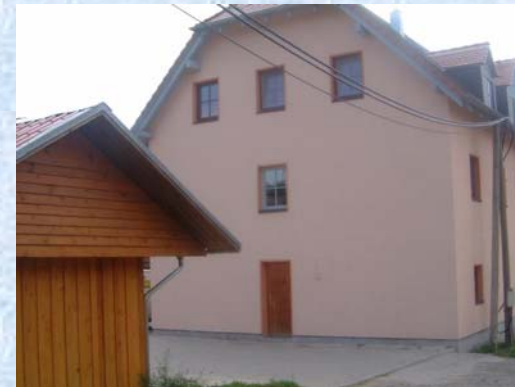
Brunnengasse 1 – Bild 4