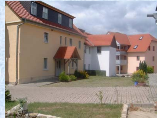
Brunnengasse 3 – Bild 2