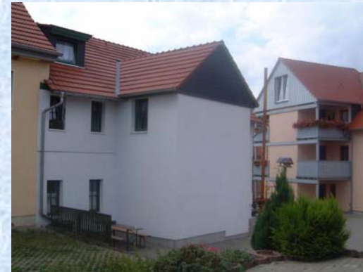
Brunnengasse 3 – Bild 4