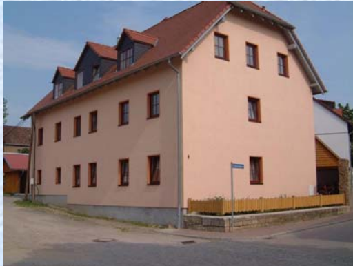
Brunnengasse 1 – Bild 1