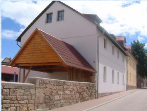
Brunnengasse 3 – Bild 1