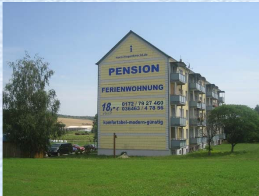
Bad Sulzaer Str. 95 – Bild 1