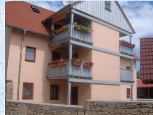
Brunnengasse 1 – Bild 2