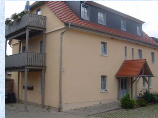
Brunnengasse 5 – Bild 4