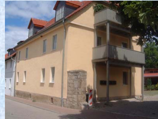
Brunnengasse 5 – Bild 2