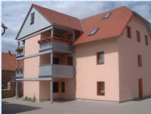
Brunnengasse 1 – Bild 3