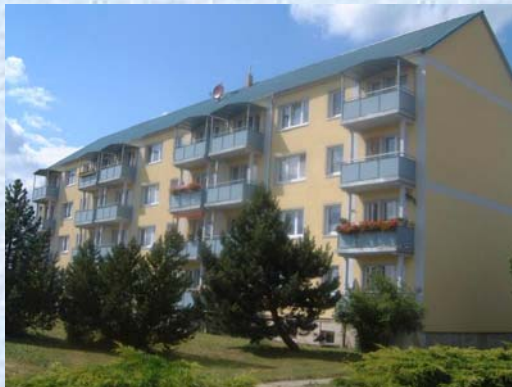
Bad Sulzaer Str. 95– Bild 3